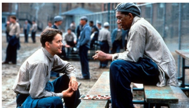
(Le ali della libertà, 1994)